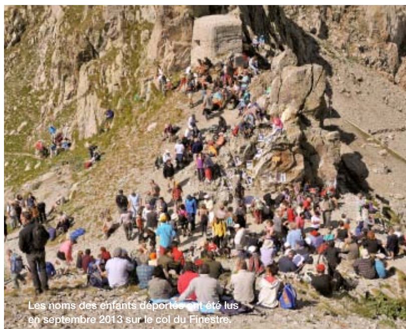
Les noms des enfants déportés ont été lus en septembre 2013 sur le col du Finestre.