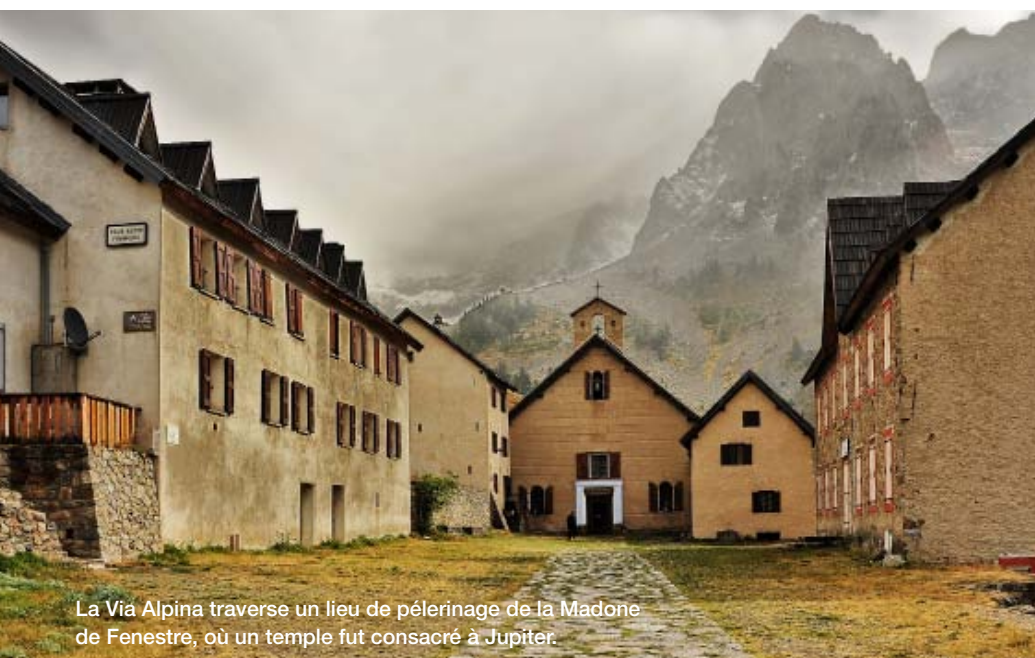
La Via Alpina traverse un lieu de pèlerinage de la Madone de Fenestre, où un temple fut consacré à Jupiter.

Informations: sur le site Via Alpina, on peut composer son propre guide avec les lieux de départ et d'arrivée. Infos supplémentaires sur le site de la rédactrice: http://westalpen.wordpress.com